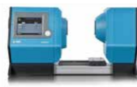
ヘイズ・ガード i ※ISO, ASTM規格を1台で行えるマルチ型ヘイズメータ