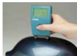
マイクロウェーブスキャン ※小部品のオレンジピールを測定