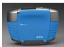
BYK-mac i ※多角度測色及びメタリック塗装の光輝感測定機