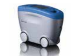
クラウド・ランナー ※業界初！塗装ムラの数値管理及びトラブルシューティング用評価機