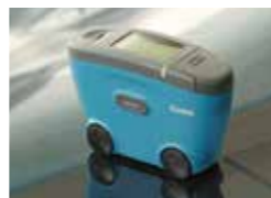
ウェーブ・スキャンデュアル ※中塗り、電着からトップコートまでオレンジピールを管理