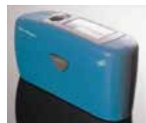
マイクロ・グロス ※全世界でご愛用を頂いている光沢計の定番「マイクロ・グロス」シリーズ