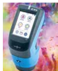
spectro 2 guide ※ LED搭載 色彩・蛍光性・光沢測定器