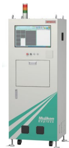
Mujiken Express 本体